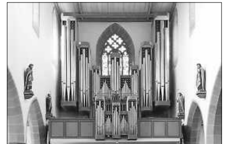
Klais-Orgel in der Stadtpfarrkirche Bad Saulgau