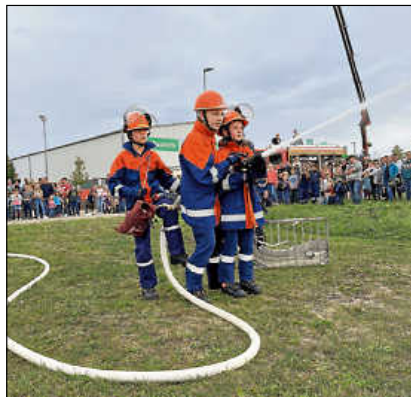
Übung der Jugendfeuerwehr