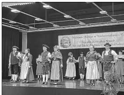
Auftritt mit der Gauganzgruppe

Bodensee-Heimat- und Trachtenverbands in Zußdorf teil. Gefeierte wurde das 40-jährige Bestehen der Trachten- und Volkstanzgruppe „Zocklerland“ Zußdorf. Beim tänzerischen Auftritt der Gaugruppe wirkten auch Mitglieder aus Bad Saulgau mit. Ein bunter Abend ganz im Zeichen von Heimat, Brauchtum und Kultur.