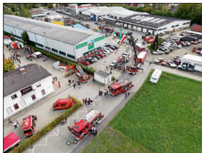
Impressionen von oben