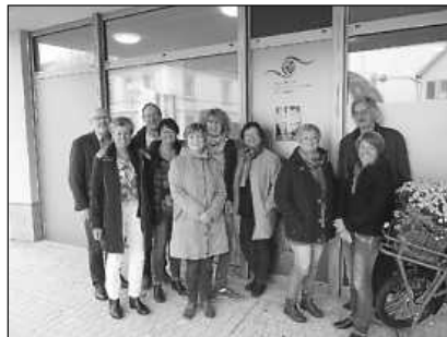
Das Team der Caritas Bad Saulgau

sich als Caritasmitarbeiter/-in an einer Entwicklung unserer Gesellschaft zu beteiligen, die auf solidarischem Umgang miteinander basiert und Menschen dazu befähigt, ein selbstbestimmtes und würdevolles Leben zu leben.