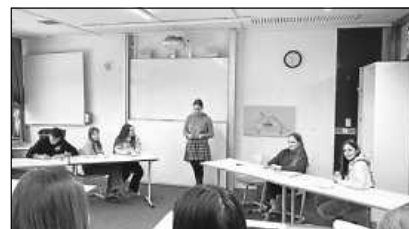
Generalprobe für die Debating-AG