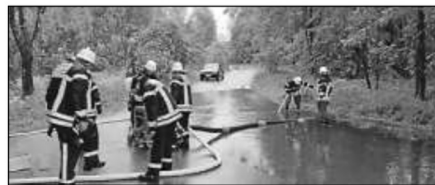
Erfolgreicher Einsatz unserer FW Abt. Bogenweiler am Haidemer Stöckle.

Die Ortsverwaltung bedankt sich sehr herzlich für den schnellen und umsichtigen Einsatz der Freiwilligen Feuerwehr Abt. Bogenweiler am vergangenen Samstag am Haidemer Stöckle. Innerhalb kürzester Zeit hatte sich während des Dauerregens aufgrund eines verstopften Ablaufschachts eine riesige Wasserlache in der Kurve am Haidemer Stöckle gebildet. Nach der Alarmierung waren die Kameraden schnell vor Ort und pumpten das Wasser größtenteils ab, so dass der Verkehr zunächst wieder ungehindert fließen konnte. Am späteren Nachmittag, während die Feuerwehrkameraden bereits im Einsatz in Moosheim waren, wurde die Stelle dann wegen des wieder ansteigenden Wasserpegels vom Bauhof abgesichert, auch diesen Männern danken wir sehr herzlich.