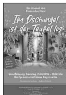
Offizielles Plakat zum Musical.