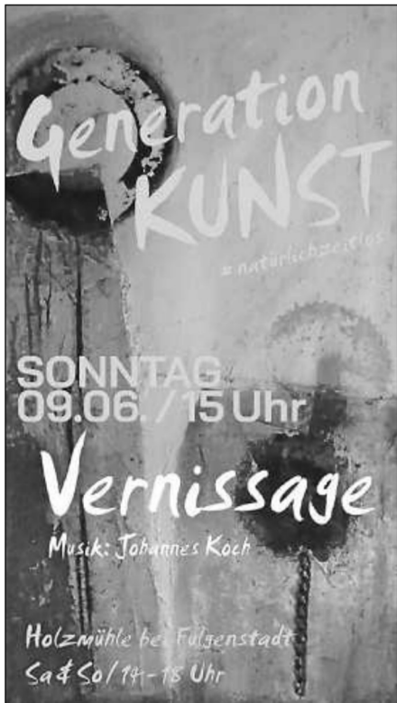
Plakat: Zone für Gestaltung