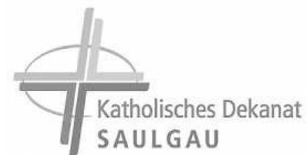
Logo: Kath. Kirchengemeinde