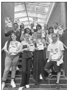
Die Klasse 1BFAHT (staatlich geprüfte Altenpflegehelfer und -helferinnen)

Nach der einjährigen Ausbildung können die Absolventinnen beispielsweise in Altenpflegeeinrichtungen oder in der ambulanten Pflege arbeiten. Außerdem besteht die Möglichkeit, jetzt oder zu einem späteren Zeitpunkt eine Ausbildung zur Pflegefachfrau bzw. zum Pflegefachmann anzuschließen. Gleich vier der Absolventinnen haben sich dazu entschieden, diesen Weg an der Helene-Weber-Schule weiterzugehen. Sieben Auszubildende haben die staatliche Prüfung zur Pflegefachfrau beziehungsweise zum Pflegefachmann als zweiter Jahrgang erfolgreich bestanden. Der seit dem 01.01.2020 neu eingeführte dreijährige Ausbildungsgang verbindet die bisherigen Berufe Altenpflege, Kinderkrankenpflege sowie Gesundheits- und Krankenpflege.