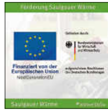
Grafik: Ifas Institut

Das Projekt „Saulgauer Wärme“ zum Fernwärmeausbau mit allen zugehörigen Aktivitäten, auch der Erstellung der Machbarkeitsstudie zum Netzausbau in Bad Saulgau werden über das Bundesministerium für Wirtschaft und Klimaschutz (BMWK) und Mitteln der Bundesförderung für effiziente Wärmenetze gefördert. Diese Maßnahme ist Teil des deutschen Aufbau- und Resilienzplans, welches aus Mitteln der Aufbau und Resilienzfazilität der Europäischen Union, NextGenerationEU, finanziert wird.