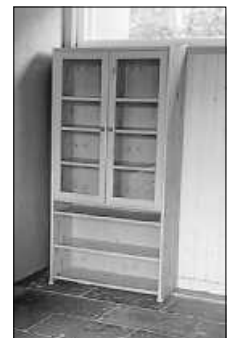
Offenes Bücherregal Fulgenstadt

In den nächsten Tagen und Wochen soll das Regal nun mit „Bücherleben“ gefüllt werden. Vorab ein paar Informationen und Regeln zur Handhabung des offenen Bücherregals: