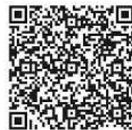
Zum Reservix-Ticketverkauf Code: Reservix

Tickets können über www.reservix.de , bei der Tourist-Info oder allen weiteren Reservix-Vorverkaufsstellen erworben werden.