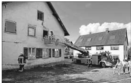
Menschenrettung per Drehleiter

der Fluchtweg aus dem Obergeschoss abgeschnitten. Zudem galt mindestens eine Person im Erdgeschoss als vermisst. Somit begab sich der Angriffstrupp unter Atemschutz ins Gebäude. Ein weiterer Trupp unter Atemschutz steuerte das Obergeschoss an, um die eingeschlossenen Kinder zu betreuen und die anstehende Rettung per Drehleiter zu organisieren. Parallel wurde durch die weiteren Einsatzkräfte der Löschgruppen aus Bondorf und Moosheim-Tissen eine Wasserversorgung aufgebaut, die Verkehrssicherung sichergestellt und zudem insgesamt drei Riegelstellungen zum Schutz der Nachbargebäude aufgrund der engen Bebauung veranlasst.