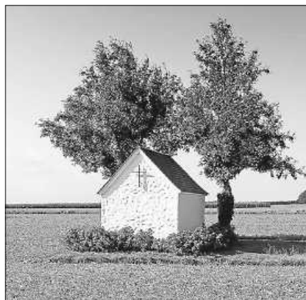
Antoniuskapelle bei Fulgenstadt

Seelsorgeeinheit Sankt Johannes Baptist Bad Saulgau