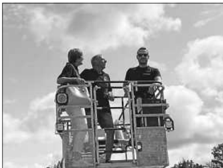
Hoch hinaus ging es für die Mitglieder bei der Bad Saulgauer Feuerwehr

Ein abwechslungsreiches und buntes Programm haben sich die Organisatoren des Trachtenvereins, für den Jahresausflug der Mitglieder, einfallen lassen.