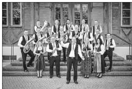
Die Oberschwäbischen Dorfmusikanten spielen im Stadtforum Bad Saulgau

Kloster Siessen – Klosterberg: Neben dem „Café im Klosterhof“ im Freien „Garagenkrippe“ auf dem Klos- terberg. Vom ersten bis vierten Ad- vents-Sonntag sowie am 26.12.2024 und 06.01.2025 sind Groß und Klein jeweils um 15 Uhr im Innenhof des Klosters zu einem kleinen Impuls mit Musik eingeladen.