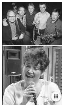
Band Foto Unit 5 und Sängerin