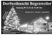
Grafik: Gerold Münch

Neben verschiedenen Hütten zum Kaufen und Genießen gibt es auch wieder Auftritte des Kinderchors sowie des Weihnachtsorchesters.