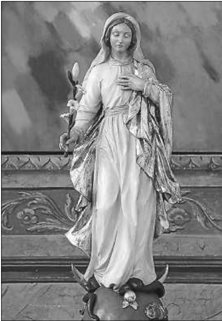
Immaculata in der Antoniuskirche