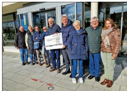
Scheckübergabe an die Stadt