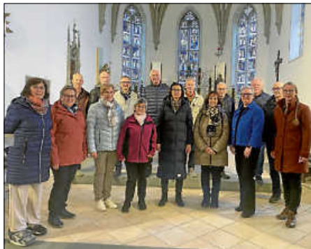
Kirchenchor Moosheim Ostern 2026

Wie jeder Chor würden auch wir Sänger vom Kirchenchor Moosheim uns freuen, wenn sich fröhliche Menschen zu uns gesellen würden. Singen tut der Seele gut. Man kann vom stressigen Alltag abschalten. Wir sind ein kleiner, feiner Chor. Dem die Freude am Singen im Vordergrund steht. Liebe Sängerfreunde, Sie sind herzlich willkommen bei uns im Moosheim im Kirchenchor. Denn Singen ist wie Schokolade, nur ohne Kalorien. Also, auf was warten Sie noch?