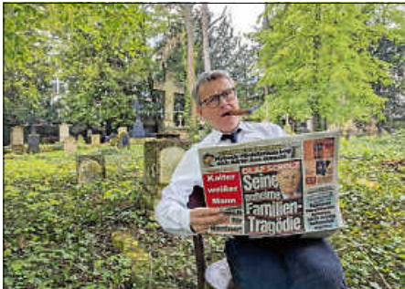
Titelbild zur bissigen Komödie „Kalter weisser Mann“

an der Spitze nicht nur seine Marketing-Leiterin, den Social-Media-Chef und seine Sekretärin gegen sich, sondern auch die sehr selbstbewusste Praktikantin. Vor dem Theaterpublikum als versammelter Trauergemeinde zerfleischt sich in diesem hochpointierten Stück schließlich die Führungsetage der Firma immer mehr. Und nicht einmal der verzweifelte Pfarrer kann die Wogen glätten. Das wendungsreiche Stück zeichnet mit scharfem Blick und lustvoller Hingabe die Abgründe, Fallstricke und rhetorischen Kniffe aktueller Diskussionen über soziale Umgangsnormen und ihre menschlich-allzu menschlichen Ursachen, weckt aber auch die Sehnsucht nach einem aufmerksamen und respektvollen Umgang miteinander. Es spielt das Landestheater Neuwied. Tickets gibt es wie immer im Vorverkauf an der Infotheke im Rathaus, bei der Tourist-Information, unter reservix.de oder an der Abendkasse. Wer mehr über die Autoren erfahren möchte, genießt um 19 Uhr im 2. OG eine kurze dramaturgische Einführung.