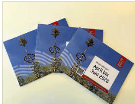
Der neue dreimonatige Veranstaltungskalender

Ihre Tourismusbetriebsgesellschaft mbH Bad Saulgau.