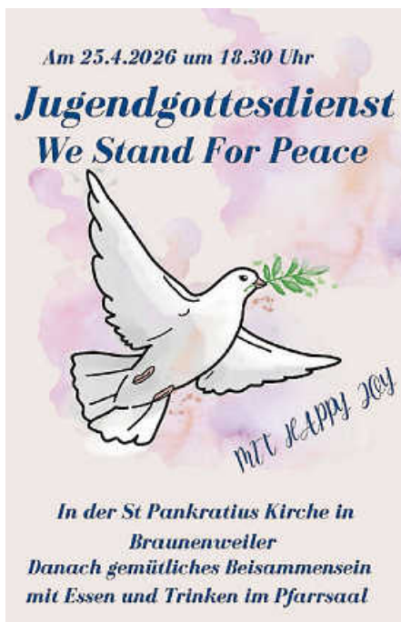
Plakat: Kath. Kirchengemeinde Braunweiler