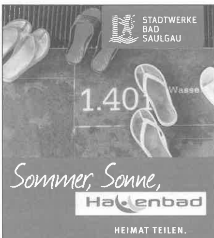
Plakat: Stadtwerke Bad Saulgau

Vom 20.07. bis 11.08.2024 geschlossen. Montag 13 – 20 Uhr Dienstag bis Sonntag 10 – 20 Uhr