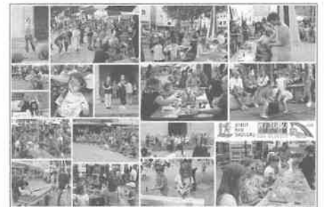
Eindrücke von der Auftaktveranstaltung 2023